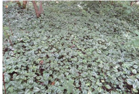
Gefleckte Taubnesselteppich unter den Gehölzen

Zwischen dem Teich samt Verlandungs- zonen und den befestigten Flächen des Bahnhofvorplatzes ist ein Pionierwald (WPW) zu finden, in dem sich junge Lin- den (Stammdurchmesser 16-21 cm) durch Samenanflug aus den benachbar- ten Lindenreihen entwickelt haben sowie Sal-Weiden, Berg-Ahornschösslinge und Haselsträucher stocken. In der Kraut- schicht wächst dort ein nitrophiler Stau- densaum (UHN) , in der Pflanzenarten wie Gefleckte Taubnessel ( Lamium macula- tum ), Gewöhnlicher Giersch ( Aegopodium podagraria ), Scharbockskraut ( Ranunculus ficaria ), Brennnessel ( Urtica dioica ) und Echte Nelkenwurz ( Geum urbanum ) vorkom- men. In diesem Bereich ist die Neuanlage des Wohnmobilstellplatzes geplant.