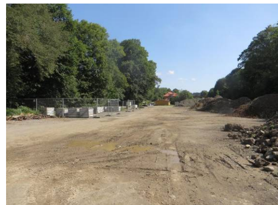
Blick über die derzeit als Lagerplatz genutzte Fläche in Richtung Bahnhofgebäude

Die genannten Anlagen werden laut DRACHENFELS (2021) als Straße (OVS), Weg (OVW) , Parkplatz (OVP) , Platz (OFL/OFZ) , sonstiger Platz (OVM) , Gebäude und