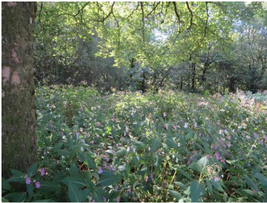
Drüsiges Springkraut im Bereich des Pionierwald und entlang des Weges