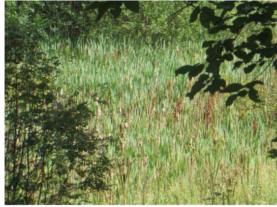
Verlandungsröhricht mit Rohrkolbendominanz

Im Übergang zwischen den tieferen Zonen des Teiches und dem Röhricht ist ein Verlandungsbereich nährstoffreicher Stillgewässer mit wurzelnden Schwimmblattpflanzen (VES) vorhanden. In ihm herrschen im Gewässergrund wurzelnden Blütenpflanzen mit Schwimmblättern vor. Zu den dort erfassten Arten gehören die Gelbe Teichrose ( Nuphar lutea ), der Wasser-Knöterich ( Persicaria amphibia ), das Schwimmende Laichkraut ( Potamogeton natans ), der Schild-Wasserhahnenfuß ( Ranunculus peltatus ), der Wasser-Ampfer ( Rumex aquaticus ) und die Kleine Wasserlinse ( Lemna minor ). Zusammen mit dem Röhricht gehört diese Verlandungszone zu den geschützten Biotopen nach § 30 BNatSchG.