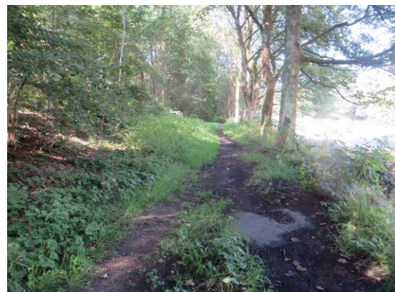
Baumreihe (Ahorn-Bäume) am Fußweg zwischen Schulgelände und Bahnhofareal