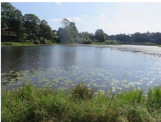
Blick über den Eulenspiegler Teich

Den größten Flächenanteil im Plangebiet nehmen der Eulenspiegler Teich und seine Verlandungsbereiche ein. Es handelt sich hierbei um einen eutrophen Stauteich mit einem Damm am nordwestlichen Ende. Der recht flache Teich wird als naturnaher, nährstoffreicher Stauteich (SES) eingestuft. Vor allem in der südöstlichen Verlandungszone des Teiches ist eine größere Röhrichtfläche (VER) vorhanden, in der Pflanzenarten wie der Wasser-Schwaden ( Glyceria maxima ), der Breitblättrige Rohrkolben ( Typha latifolia ) und Rohrglanzgras ( Phalaris arundinacea ) dominieren. Kleinere Zonen des Röhrichts sind als Uferstaudenflur (UFT) auch verteilt um den Teich zu finden, zumeist als schmale Streifen. Durch die invasive Ausbreitung des Drüsigem Springkrautes ( Impatiens glandulifera ), wird die heimische Flora im Röhricht stellenweise verdrängt. Außerdem etabliert sich im Verlandungsbereich vermehrt auch die Ohr-Weide ( Salix aurita ). Diese gehölzbestandenen Bereiche werden als Weiden-Sumpfgbüsche nährstoffreicher Standorte (BNR) angesprochen.