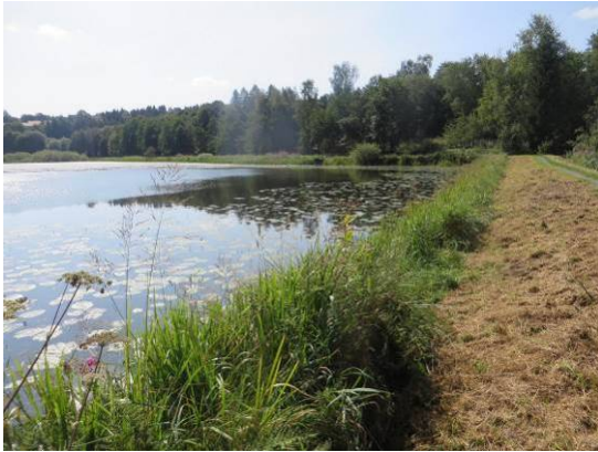
Uferstaudenflur im Bereich des Dammes