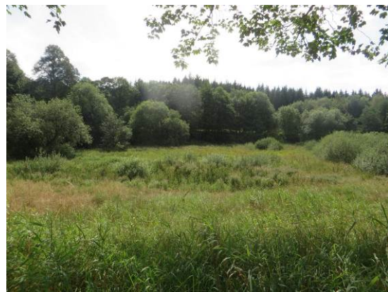
Verlandungsröhricht mit Weidengebüsch