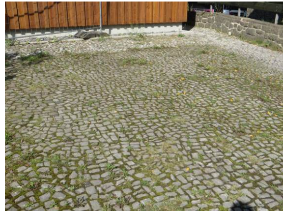
Natursteinpflaster am alten Bahnhofgebäude

Südwestlich vom ehemaligen Bahngelände sind noch alten Gleisanlagen der Tagesförderbahn zum Ottiliae-Schacht vorhanden (s. rechtes Foto). Die Gleisanlagen sollen in östliche Richtung bis auf die Höhe des Busbahnhofs fortgeführt werden. Eine alte ausgemusterte Lok befindet sich als Schauobjekt zwischen dem Parkplatz und der Bücherei.