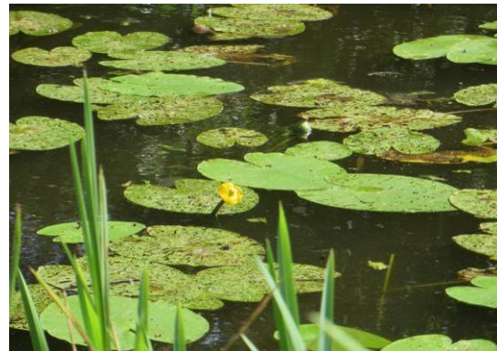
Am häufigsten ist die Gelbe Teichrose vertreten

Am nordwestlichen Rand des Bahnhofsvorplatzes sowie entlang des Weges östlich des Teiches breitet sich zunehmend eine artenarme Neopyhtenflur (UNS, UNK) aus Drüsigem Springkraut ( Impatiens glandulifera ) und Staudenknöterich ( Fallopia japonica ) aus. Diese problematischen invasiven Arten verdrängen die heimische Flora und führen zu einer Verarmung der heimischen Pflanzenwelt.