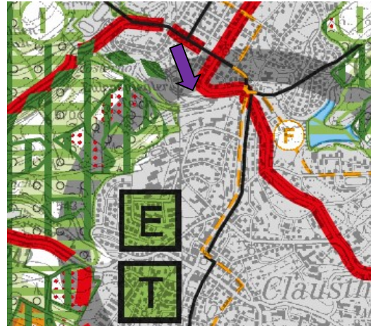
Abb. 3: Ausschnitt aus dem RROP des Großraumes Braunschweig (Lage des Plangebietes s. lila Pfeil)

Städte einen „Mittelfunktionalen Verbund mit oberzentralen Teilfunktionen“ bilden. Im Regionalen Raumordnungsprogramm (RROP) wurde die Festlegung übernommen. Die oberzentralen Funktionen betreffen die Bereiche Bildung und Gesundheitswesen. Dies berücksichtigt die Tatsache, dass im Verbundgebiet bereits seit Jahrzehnten Einrichtungen des Bildungssektors und des Gesundheitswesens vorhanden sind, die eine überregionale Bedeutung haben. Clausthal Zellerfeld kommt zudem die besondere Entwicklungsaufgabe Erholung und Tourismus zu. Der Planbereich wird der Ortslage zugeordnet. Die Flächen südlich davon sind als Vorranggebiete für Natur- und Landschaft sowie für Erholung (mit starker Inanspruchnahme durch die Bevölkerung) verzeichnet. Die Lindenallee entlang der Nordostseite des Eulenspiegler Teiches wird als Vorranggebiet Natur- und Landschaft mit linienhafter Ausprägung im Plan dargestellt.