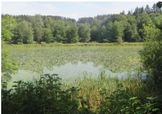
Teichfläche mit Schwimmblattgesellschaft

Im Übergang zwischen den tieferen Zonen des Teiches und dem Röhricht ist ein Verlandungsbereich nährstoffreicher Stillgewässer mit wurzelnden Schwimmblattpflanzen (VES) vorhanden. In ihm herrschen im Gewässergrund wurzelnden Blütenpflanzen mit Schwimmblättern vor. Zu den dort erfassten Arten gehören die Gelbe Teichrose ( Nuphar lutea ), der Wasser-Knöterich ( Persicaria amphibia ), das Schwimmende Laichkraut ( Potamogeton natans ), der Schild-Wasserhahnenfuß ( Ranunculus peltatus ), der Wasser-Ampfer ( Rumex aquaticus ) und die Kleine Wasserlinse ( Lemna minor ). Zusammen mit dem Röhricht gehört diese Verlandungszone zu den geschützten Biotopen nach § 30 BNatSchG.