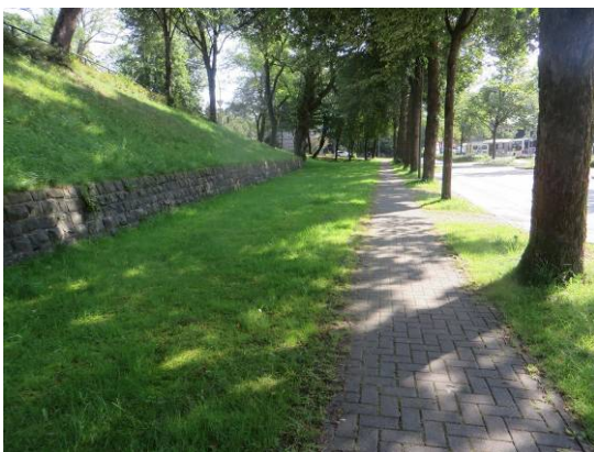
Lindenreihe am Busbahnhof

Das Plangebiet weist einen umfangreichen Gehölzbestand auf. Besonders prägend ist hier die Baumreihe aus alten Winter-Linden, die im Osten beim Busbahnhof beginnt, im Bereich des Bahnhofes unterbrochen ist und sich dann entlang des Weges am nordöstlichen Ufer des Teiches fast bis zum Dammbauwerk fortsetzt. Die Bäume weisen Stammdurchmesser von 0,4 bis 0,6 m auf. Weitere Linden gleichen Alters wurden auf einer Grünfläche im Mündungsbereich Telemannstraße / Am Alten Bahnhof gepflanzt sowie als Baumreihe am Nordrand des geschotterten Platzes. Auch der Busbahnhof und ebenso der Parkplatz wurde mit Winter-Linden (Stammdurchmesser 0,2 bis 0,3 m) begrünt, während in der Grünfläche südlich davon vermehrt Spitzahorn-Bäume verwendet wurden. Eine weitere Baumreihe (Ahorn-Bäume) wurde entlang des schmalen Fußweges zwischen Schulgelände und Bahnhofumfeld. Die Bäume werden als Einzelbaum, Baumgruppe des Siedlungsbereiches (HBE) eingeordnet.