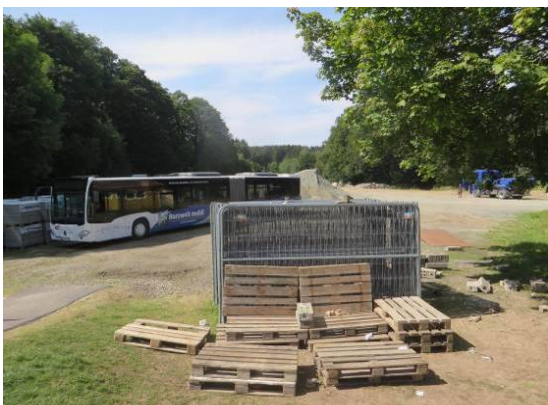
Blick vom Fahrradparcour nach Westen über den geschotterten Platz

Westlich vom alten Bahnhofsgebäude befindet sich ein großer, geschotterter Platz der derzeit der Lagerung von Boden und Baustoffe dient, ansonsten als Festplatz der Kommune zur Verfügung steht. Dort soll eine bauliche Erweiterung für die Einrichtungen des Gemeinbedarfs ermöglicht werden.