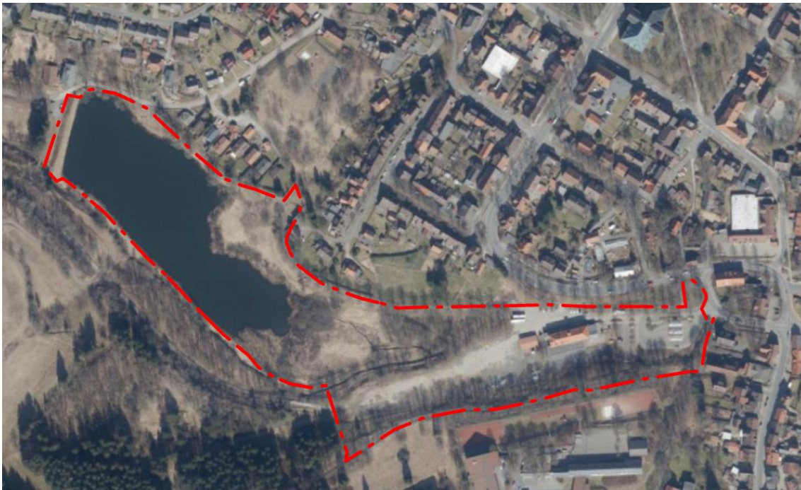
Abb. 1: Lage des Planungsraumes

Die Stadt Clausthal-Zellerfeld plant im Bereich des ehemaligen Bahnhofes den Bau einer Schulmensa und einiger Verwaltungsräume. Außerdem sollen in diesem Bereich Stellplätze für Wohnmobile geschaffen werden. Um das Vorhaben realisieren zu können, müssen ein Bebauungsplan aufgestellt und der Flächennutzungsplan geändert werden. Außerdem sollen in dem Bebauungsplan die vorhandenen und geplanten Einrichtungen für touristische Zwecke baurechtlich gesichert werden. Daher hat der Verwaltungsausschuss der Berg- und Universitätsstadt Clausthal-Zellerfeld in seiner Sitzung am 12. September 2023 die Aufstellung des Bebauungsplanes Nr. 31 „Alter Bahnhof Clausthal-Zellerfeld“ beschlossen. Im Parallelverfahren soll der Flächennutzungsplan in seiner 94. Änderung an das Vorhaben angepasst werden. Das Plangebiet umfasst eine Fläche, die vom heutigen ZOB bis zum Damm des Eulenspiegler Teiches reicht (s. folgende Abbildung 1).